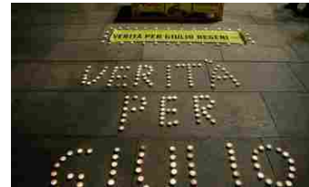
Egitto: 'Processo Regeni immotivato'. Ira dell'Italia