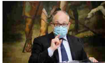
Deficit, bonus e mance. La manovra è legge